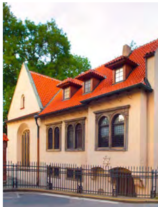
La sinagoga Pinkas