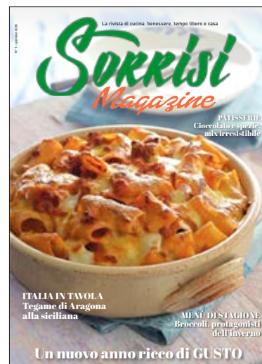
La ricetta del mese in copertina: Tegame di Aragona alla siciliana