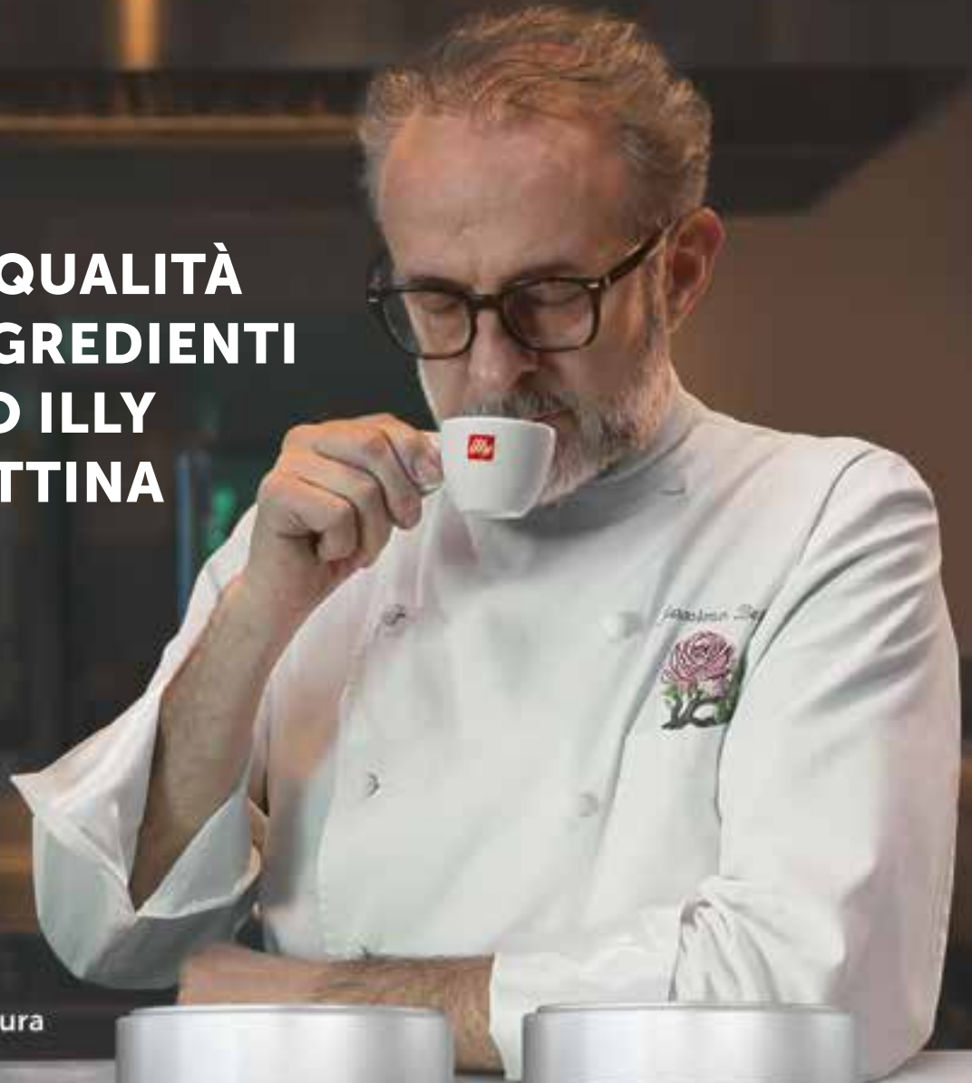
Chef Massimo Bottura

È PER LA QUALITÀ DEGLI INGREDIENTI CHE BEVO ILLY OGNI MATTINA