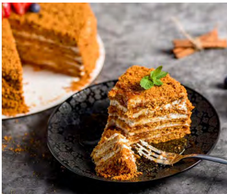
Una fetta di Medovník

La cucina praghese è ricca di piatti "impegnativi", robusti e calorici, perfetti nella stagione fredda. Tra le ricette tipiche rientrano il gulasch accompagnato dai knedlíky (grandi gnocchi di pane), l'anatra arrosto con crauti rossi, la carne di maiale ( vepřové ), il formaggio fritto e le zuppe tradizionali. Praga è famosa anche per i suoi numerosi dolci, come - solo per citarne alcuni - i Palačinky (pancake alla ceca, simili alle crepes, farciti con marmellata, cioccolato e frutta), la Medovník (torta a strati, con sfoglie sottili di pan di zenzero al miele e un ripieno di crema di latte condensato) e la Bublanina , simile a un clafoutis preparato con frutta fresca mischiata nella pastella e cotto in forno, per poi essere servito con panna montata. A Praga, infine, c'è una lunga tradizione brassicola, con numerosi birrifici e una storica cultura birraria.